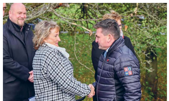
se kromě kraje podílela také obec Kramolna, v jejíž režii došlo k vybudování nových chodníků v obou obcích.