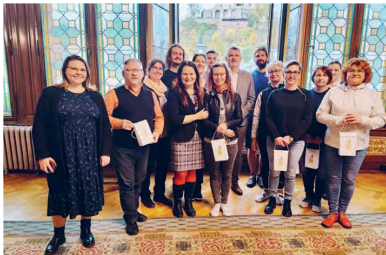
V rámci dvouletého projektu Experience it! - Zažij to!, který vznikl ve spolupráci náchodského Děčka a Asociácie centier voľného času Slovenska, a je zaměřený na zážitkovou pedagogiku, přijeli 2.11. do Náchoda pracovníci s mládeží z obou zemí, aby se společně vzdělávali a předávali si cenné zkušenosti.

Kraj otevřel opravenou silnici v Kramolně a Trubějově Královéhradecký kraj dokončil další z rekonstrukcí silnic na Náchodsku. Po roční uzavírci se zprovoznil více jak tříkilometrový úsek silnice III/3036 mezi Kramolnou a Trubějovem. Náklady za stavební práce vyšly na více jak 70 milionů korun včetně DPH. „Více jak 3,3 kilometru dlouhý úsek silnice jsme kompletně vyfrézovali, vybouraly se také konstrukční vrstvy pro provádění sanace krajů komunikace. Kromě nové vozovky stavbaři postavili opěrnou zeď v Kramolně i Trubějově. Kompletně vyměnili také uliční vpusti pro lepší odvodnění komunikace a nových chodníků,“ popsal rozsah rekonstrukce hejtmán Královéhradeckého kraje Martin Červíček (na fotografii se starostkou